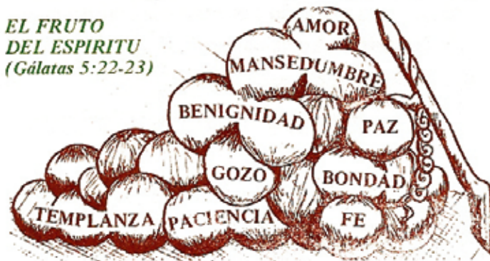
EL FRUTO DEL ESPÍRITU (Gálatas 5:22-23)

el carácter de virtud y santidad en la vida de cada seguidor de Jesús.